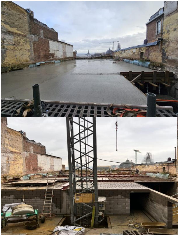
PROJET LE CLOU DORE